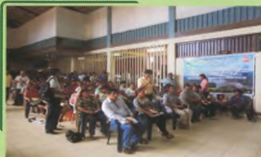
Productores Mineros Capacitados por el Proyecto Minero