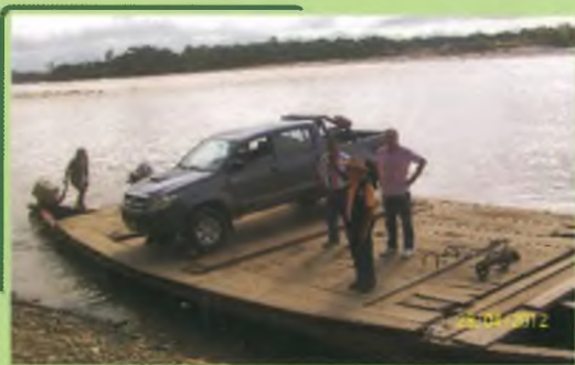
Profesionales del Proyecto en pleno Bandedo de camioneta hacia Puerto Carlos